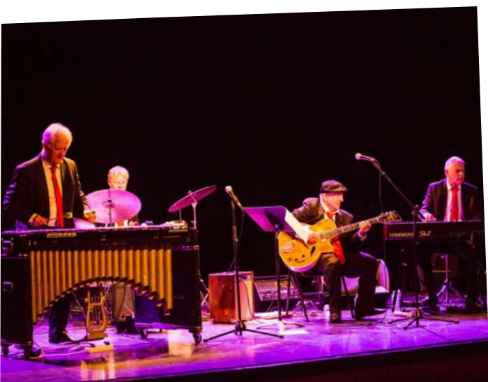
Caveau de la Huchette, 2021

Tous les concerts sauf l'orchestre de jazz, ont lieu sur la place du marché.