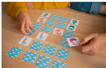
>> Enfants de 4 à 12 ans