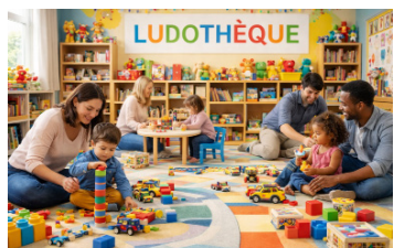
>> Pour les 3-12 ans