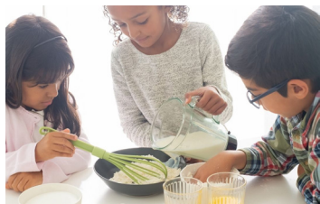
>> Enfants de 3 à 12 ans